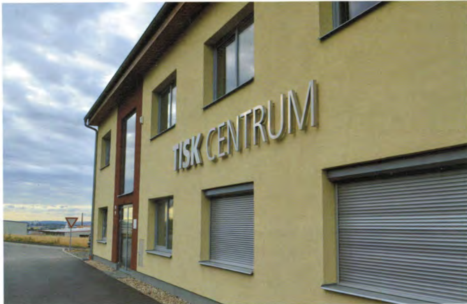
Nový areál společnosti TISK CENTRUM vyrostl v Moravanech u Brna.

Společnost TISK CENTRUM působí na polygrafickém trhu pouze deset let; její historie se začala psát v roce 2001. Během této doby se však vypracovala ve velmi moderní polygrafický závod, který může svým zákazníkům nabídnout zpracování zakázek nejenom ve velké rychlosti, ale i ve velmi dobré kvalitě. Společnost přitom nevznikala jako většina konkurenčních polygrafických společností. Postupem času se totiž vyprofilovala z reklamní agentury, která začala zjišťovat, že cesta kooperací není tím správným směrem, kterým by se měla společnost ubírat. Velké množství kooperací totiž s sebou přináší i zvýšení rizika případných chyb, prodloužení časů zpracování apod. S tím, jak se začínalo zvětšovat množství zakázek, začal se taktéž zvětšovat podíl operací, které začala společnost zpracovávat vlastními silami. Během poměrně krátké doby se z reklamní agentury začala stávat tiskárna, která díky tomuto vývoji mohla nabídnout celou řadu dílčích operací. V tisku se přitom zabývala nejenom ofsetovým tiskem, ale i dalšími technologiemi, které směřují spíše do segmentu reklamního tisku. Také v oblasti kni-